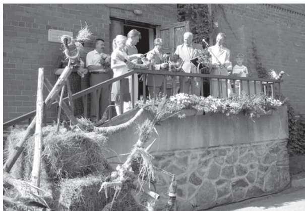
Tirgus var sākties.