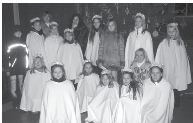
MĒS TEVI GAIDĪSIM!

NĀC – PIE MUMS IKVIENS JŪTAS VAJADZĪGS, GRIBĒTS, NOVĒRTĒTS!