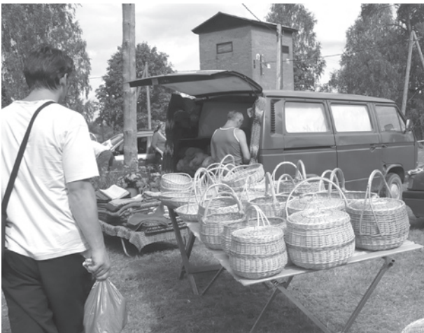
Grozu pinēji pat no Mārupes atbraukuši, bet pats darbarūķis noslēpies aiz kadra.