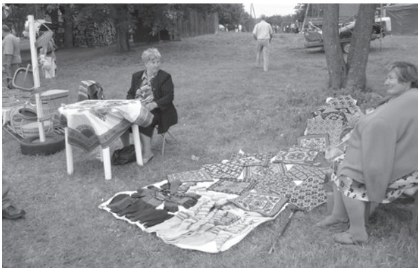
Arī par tuvojošos ziemu varēja sākt gādāt. Cimdi un zeķes lielā izvēlē.