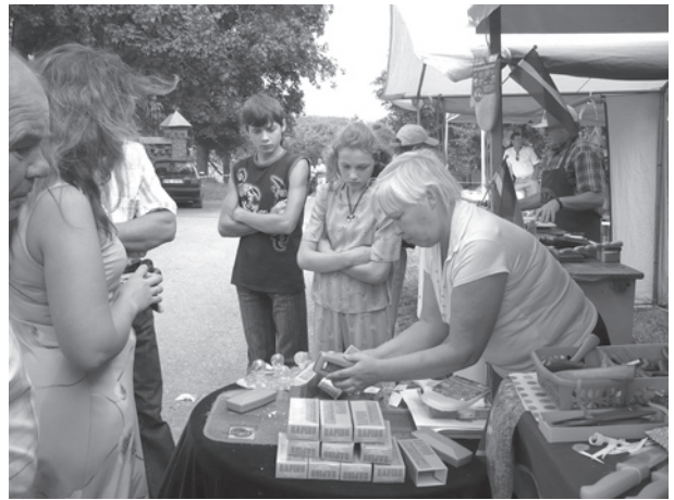
Viss saimniecībā nodērēs.