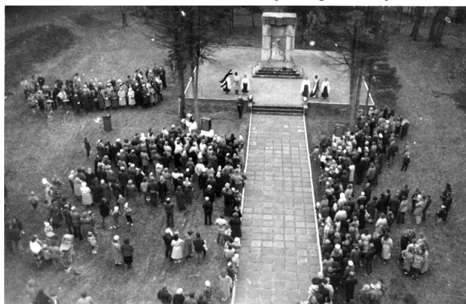
1988. gadā notika pieminekļa jaunatklāšana.

Profesionālo izglītību Zāle ieguva Kazaņas mākslas skolā, vēlāk devās uz Maskavu, kur strādāja Stepana Erzjas darbnī-