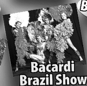
Bacardi Brazil Show