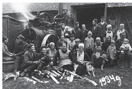
Pirms 75 gadiem.

Maija (m.t.29131170) un Lolita (m.t.28729039).