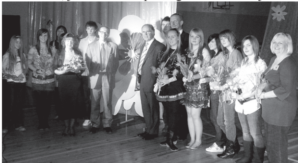
Projekta grupa ar viesiem.