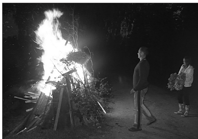
Tiek dedzināti iepriekšējā gada Jāņu vainagi. Šoreiz tos ugunskurā met pats Jānis.