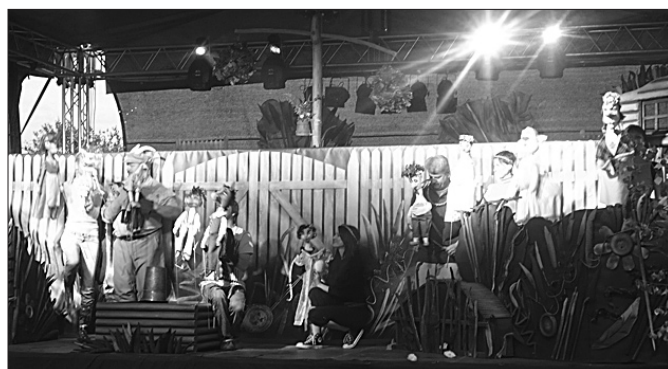
Lizumā X parkā skatītāji varēja būt liecinieki, ka interesants uzvedums „Skroderdienas Silmačos” sanāk arī Leļļu teātra izpildījumā. Pasākumu virkni turpināja Lielvārdes kora enerģiskā uzstāšanās.