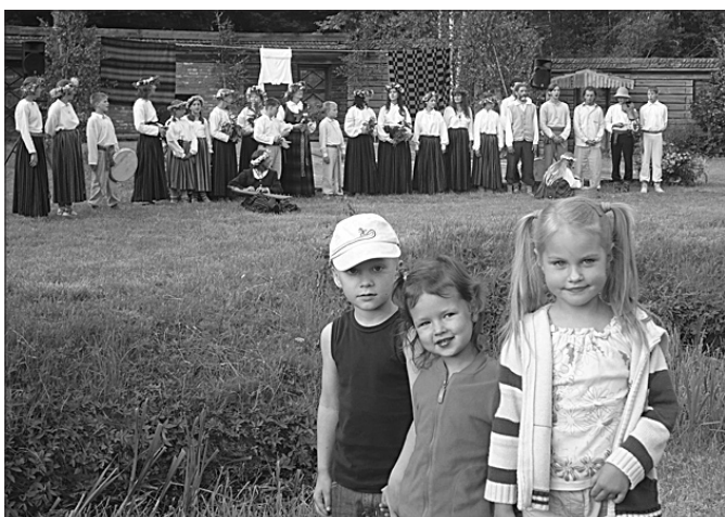
21. jūnijā vakars Druvienā.