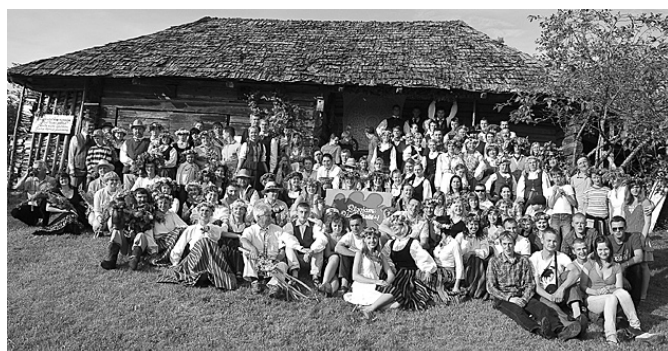
Plašākie Zāļu vakara svētki tuvākā apkārtņē gan laikam notiek „Lielkrūzēs”.