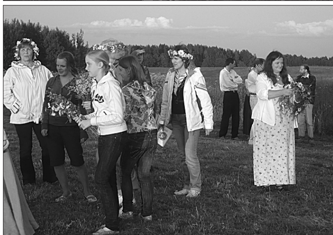
Ligo svētkus un Jāņu dienu iedziedāja Viņķu kalnā.