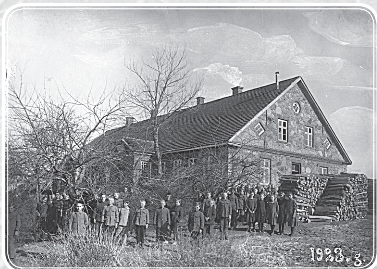
Pēterskola 1923. gadā.