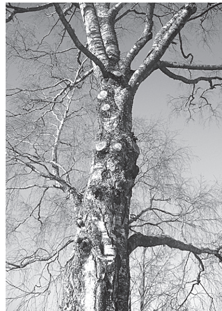
Arī šis bērzs raud.

Kūlas dedzināšana notiek arī Jaunpiebalgā. Vai dienesti, kas izmeklēs kūlas dedzināšanu pie vidusskolas, atradīs vainīgo? Tomēr nākamajā avīzītē gaidām informāciju par izmeklēšanas gaitu. Atgādinām! Par kūlas dedzināšanu draud administratīvais sods no 200 līdz 500 latiem vai administratīvais arests līdz 15 diennaktīm.