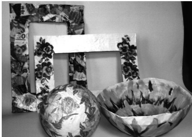
Attēla: papjē – mašē tehnikas apgūšana. Radošās darbnīcas dalībnieku darbiņi.