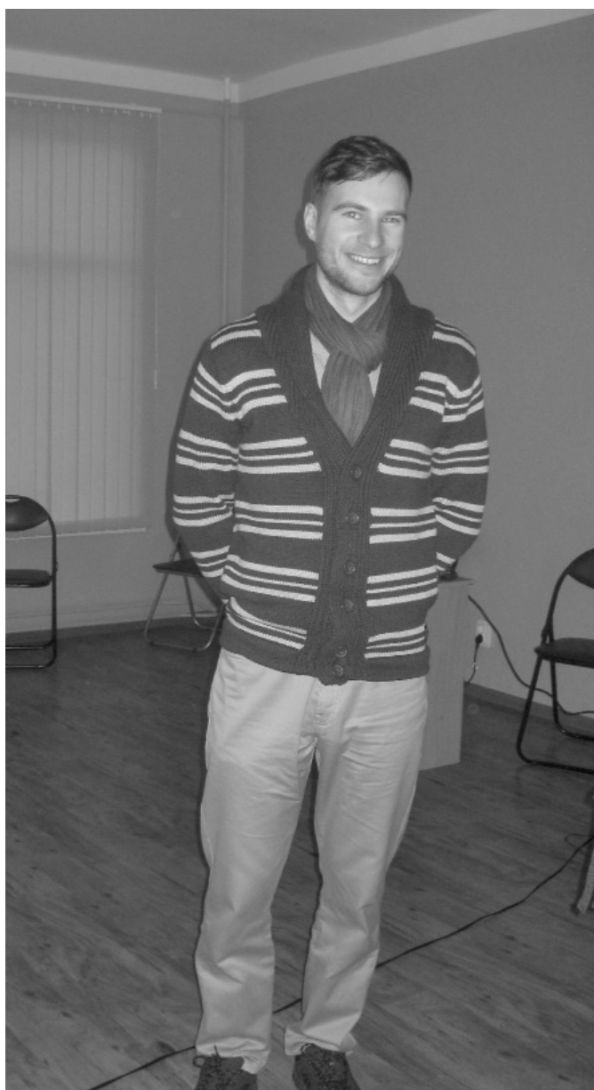
Attēlā: 100 latviešu stāstu stāstītājs un pasaules apceļotājs Ģirts Smelters ciemojās Melnbāržu jauniešu centrā.