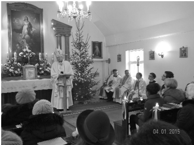
Attēlā: arhibīskaps Z.Stankevičs, uzrunājot klātesošos Svētās Mises laikā.

Jubilejas pasākuma saviesīgajā daļā ikviens no klātesošajiem tika mīļi aicināts uz kultūras namu. Arī tur sagaidīja pārsteigums – neliels mūzikas skolas audzēkņu koncerts.