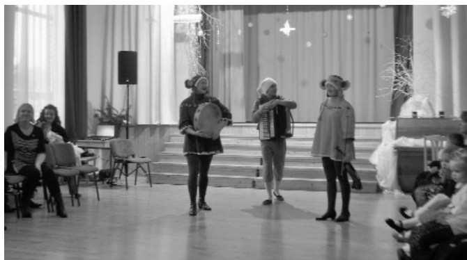
Attēlā: novada pirmsskolas bērnu Ziemassvētku eglīte ar Rikšu rūķiem.