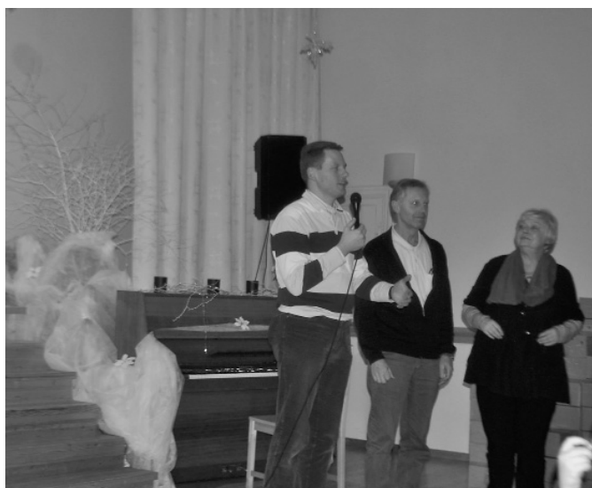
Attēlā: Austrijas delegācija, kas atveda dāvanas no šīs valsts bērniem.