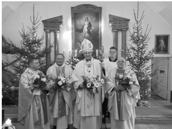
Attēlā: arhibīskaps un prāvesti.