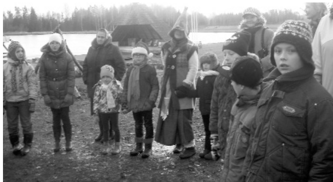
Attēlā: pašdarbības kolektīvu ekskursija pie „Gaujmalas rūķiem” „Lielkrūzēs”.