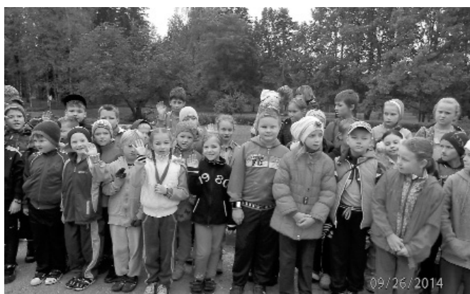
Attēlā: skolēni gatavi Olimpiskās dienas pasākumiem.

26. septembrī visa skola piedalījās Olimpiskajā dienā. Rīts sākās ar Olimpiskā karoga pacelšanu un kopīgu vingrošanu 1.-12. klasei skolas sporta zālē. Pēc tam skolēni piedalījās pretstafetēs un tradicionālajā rudens krosā – ieskaitē 300 m 1. – 4. klašu sko-lēniem.