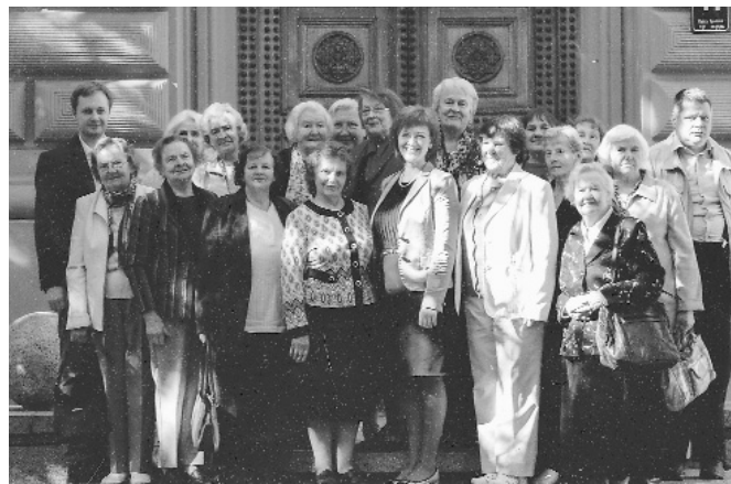
Attēlā: mūsu pensionāru ekskursija uz Rīgu pagājušā gada vasarā - pie Saeimas nama.