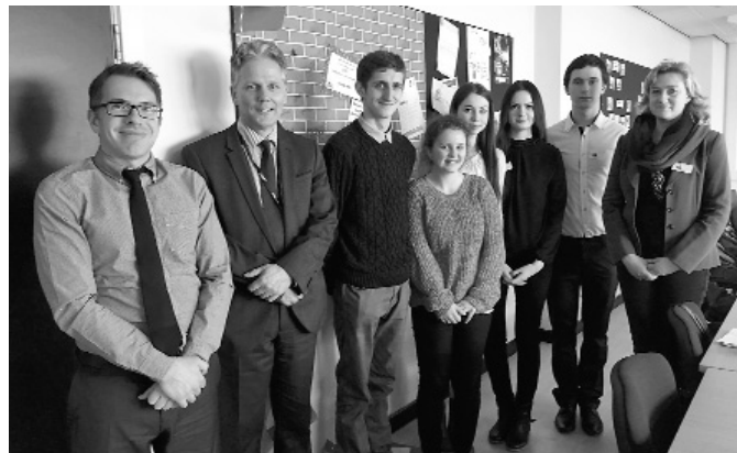
Attēlā: Llanishen un Jaunpiebalgas vidusskolu skolēnu un skolotāju grupa skolā Kārdifā.