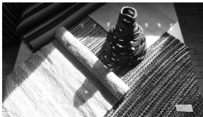
Attēlā: studijas dalībnieču veidotais tekstilansamblis izstādei.