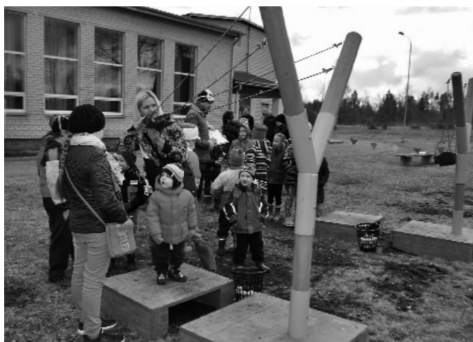
Attēlā: līdžīgi kā senāk bija iespēja šaut ar lielo kaķeni un trāpīt olai.