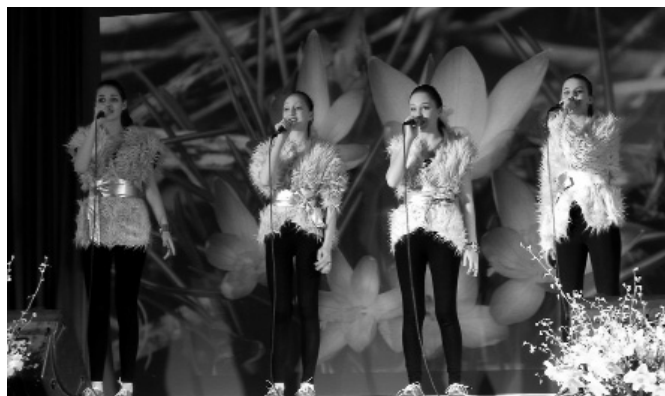
Attēlā: dziedājošo meiteņu grupa „Espresso” no Rīgas.