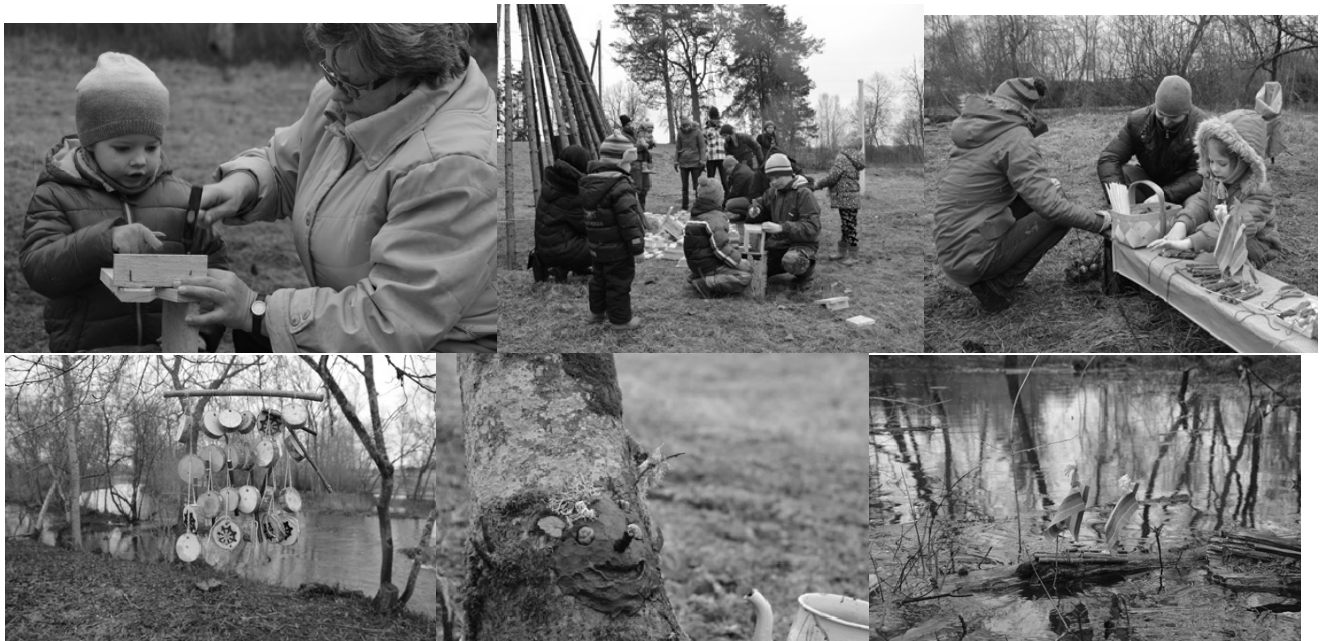
Attēlos: 5.apriļa pasākuma „Ieklausies dabā!” norises laikā.