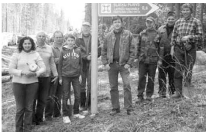
Pirmā norāde tika uzstādīta meža ceļa sākumā