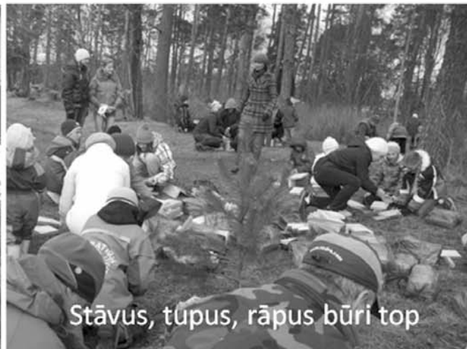
Stāvus, tūpus, rāpus būri top