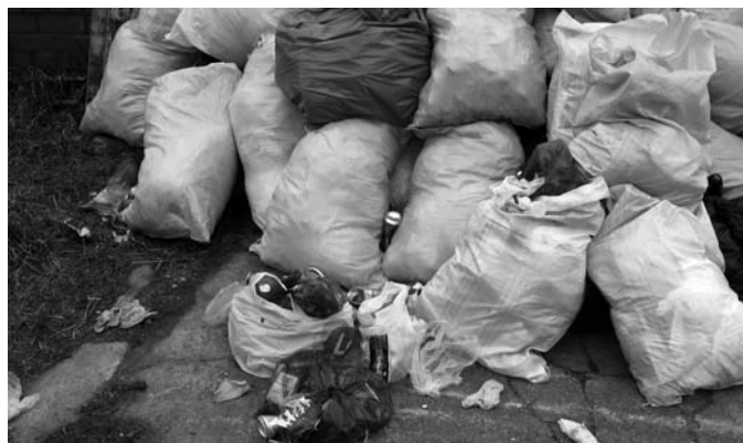
Pie daudzdzīvokļu mājām šāds skats. Tai pat laikā atkritumu konteineri tukši