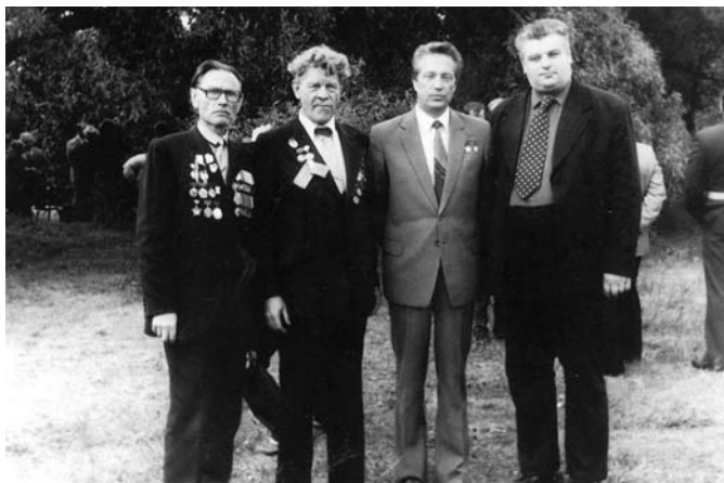
Tiekoties ar divkāršo Padomju Savienības varoni kosmonautu Vladimiru Aksjonovu