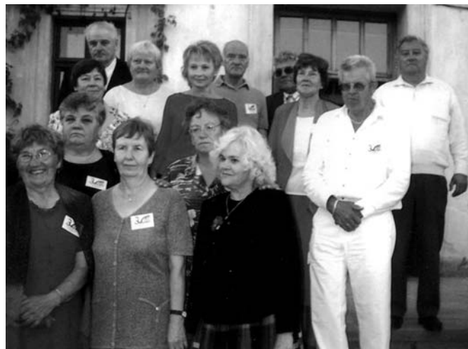
Absolventu (1961) salidojums Stāmerienā. 2007. gada 22. septembrī. Redzama daļa salidojuma dalībnieku