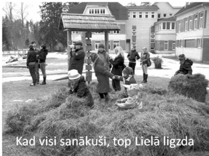
Kad visi sanākuši, top Lielā ligzda