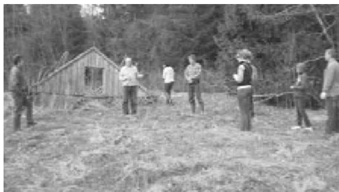
Pļaviņā vēlreiz tika atstāstīta kauja, un stāstījumu papildināja vēsturnieks Zigmārs Turčinskis, kurš īpaši pievērsies Latvijas nacionālo partizānu gaitu pētniecībai. Tad mēs ķērāmies pie piemiņas zīmes uzstādīšanas