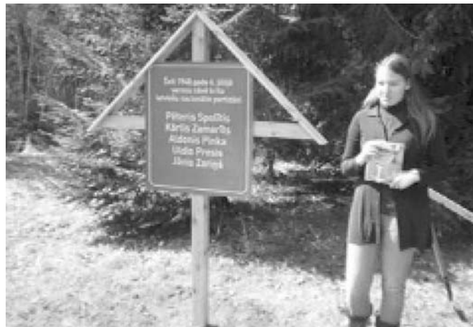
Kad zīme bija uzstādīta, pie tās tika noturēts piemiņas brīdis