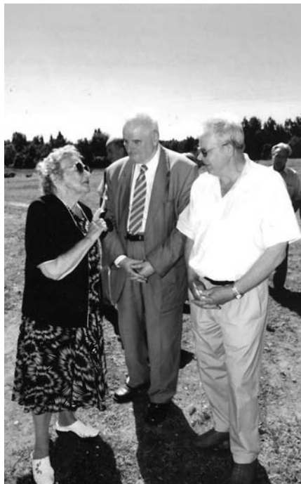
2010. gada 3. jūlijā Jaunpiebalgā. Vidusskolas 1961. gada absolventi sarunājas ar ilggadīgo skolas direktori