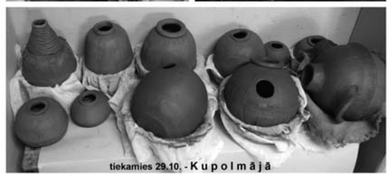
tiekamies 29.10. - Kupolmājā