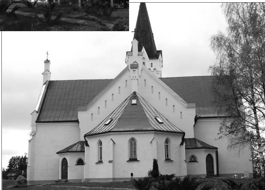
Baznīcas ārpusē 22. septembrī ar sastatnēm, bet pēc nepilna mēneša jau ārsienas darbi pabeigti

No jauna papildīnu ziedotāju sarakstu. Paldies, ka esat norādījuši konkrētu mērķi - baznīcas logiem vai iekšpuses atjaunoša-