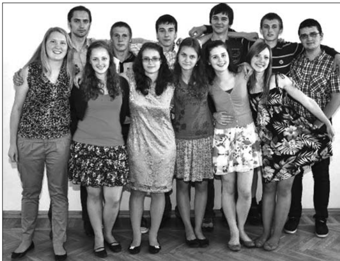
Attēlā: ķīmijas un bioloģijas sekcijas dalībnieki

No 1. līdz 21. jūlijam Jēkabpils novada Zasas vidusskolā norisinājās vasaras skola – seminārs „Alfa 2012”. Šī nometne notika jau 45. reizi. Tās dalībnieki bija valsts olimpiāžu un zinātnisko konferenču uzvarētāji, kurus iedalīja četrās lielās sekcijās: bioloģija un ķīmija, matemātika un informātika, fizika, humanitārā un sociālā.