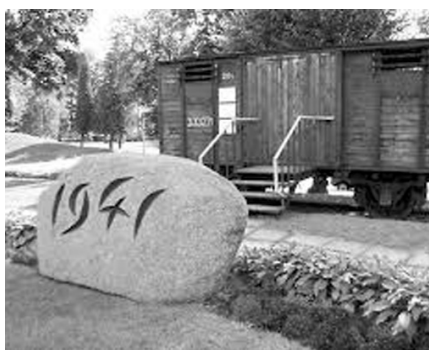
Foto: „Melnais sliekšnis” - Okupācijas muzeja izveidota piemiņas zīme padomju okupācijas upuriem Rīgā, Brīvības ielā 61 (t.s. „čekas mājā”).

No 1941.gada līdz kara beigām LPSR arestēja 14 428 personas. 1941. gada 14. jūnijā no Latvijas izsūtīto personu lietas apkopotas Latvijas Valsts vēstures arhīva fondos.