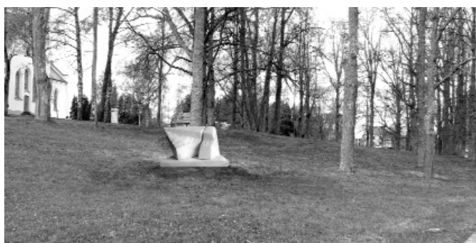
Attēlā: piemiņas zīmi iecerēts novietot birzs austrumu malā netālu no esošā gājēju celiņa gar Gaujas ielu.