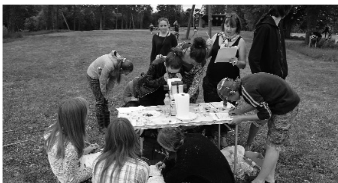
Attēlā: skolēni nodarbības laikā.