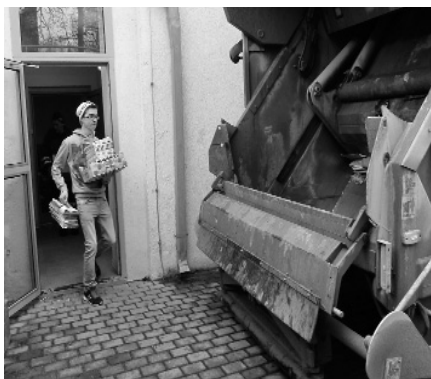
Attēlā: makulatūras iekraušana ZAAO transportā.

Vidzemes zonā ZAAO rīkotajā atkritumu šķirošanas akcijā 2014.gadā Jaunpiebalgas vidusskola ieguva IV vietu un balvu - ekskursiju pa Latviju. Akcijas noslēguma pasākumā Smiltēnē