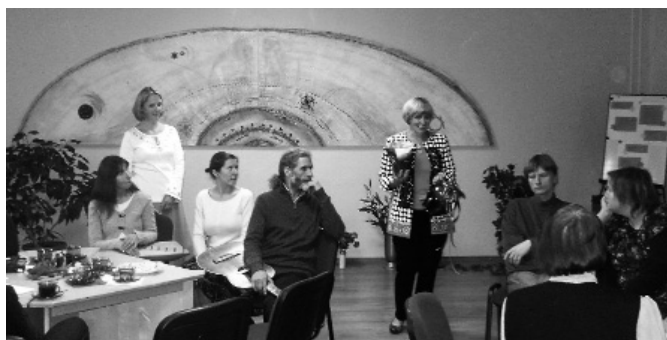
Attēlā: tautskolas atvērto durvju diena