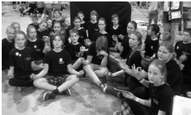
Attēlā: 5.klases komanda.