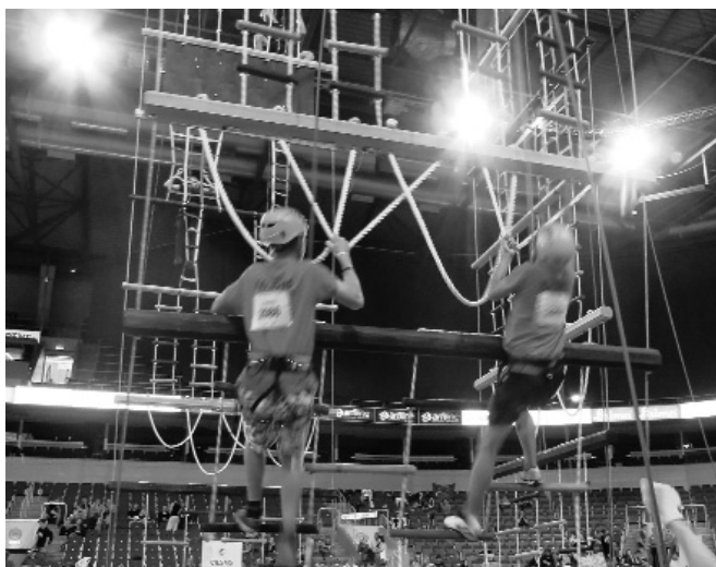
Attēlā: kāpšana ZZ tornī 12 metru augstumā.