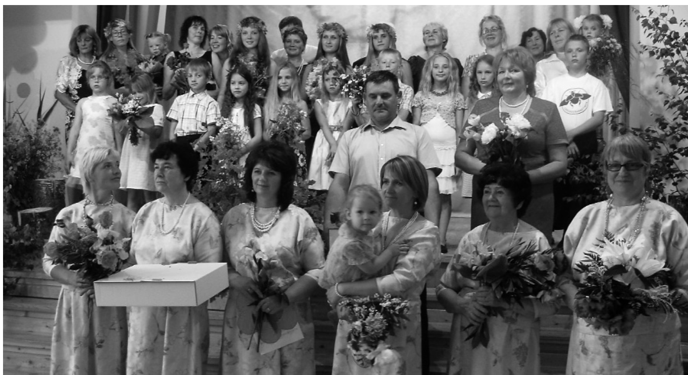
Attēlā: pašdarbnieku atskaites koncertam izskanot.