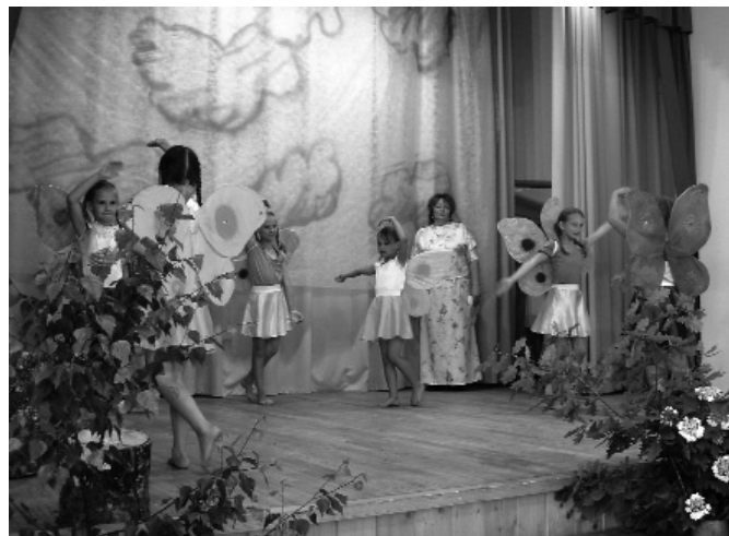
Attēlā: Zosēnu pagasta pašdarbnieku uzstāšanās – bērnu priekšnesums.