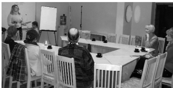
Attēlā: vecāku sarunas.