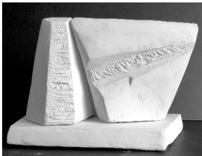
Attēlā: granīta piemineklis tiks veidots karoga silueta formā, kurā izkalta simboliska dziļa rēta.