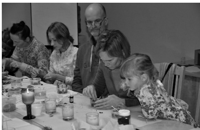
Attēlos: eko sveču darbnīca.