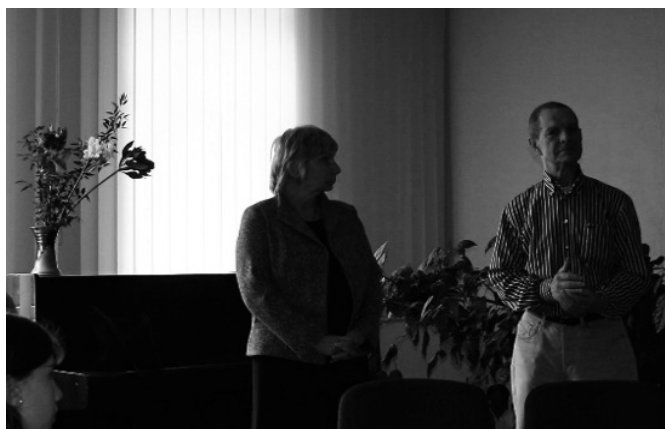
Attēlā: tikšanās ar „Zīmogs sarkanā vaskā” radošo komandu.