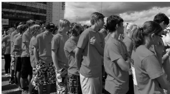
Attēlā: 8.klases komanda.