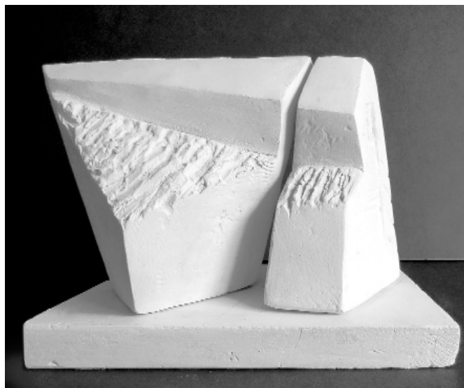
Attēlā: granīta bluķis ir sadalīts divās daļās, kur šaurās spraugas vertikāle pāršķēļ horizontālo pulēto līniju un veido krusta zīmi.