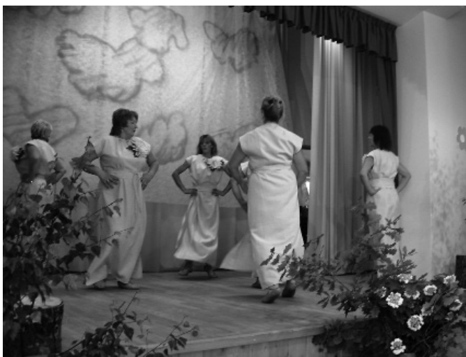
Attēlā: Zosēnu pagasta pašdarbnieku uzstāšanās – dāmu dejas.

Zosēnu kultūras un sabiedriskā centra vadītāja