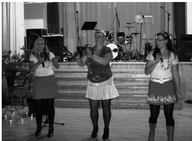
Attēlā: POPIelas dalībnieces – grupa „Latgales dāmu pops”.

Uz kultūras notikumiem atskatījās Dzidra Prūse , Zosēnu Kultūras un sabiedriskā centra vadītāja.