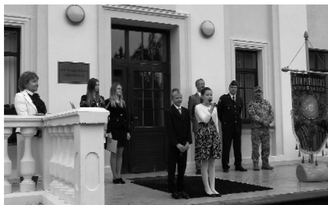
Attēlā: 1.septembrī – Zinību dienā. Vārds tiek dots lielās skolas mazākajiem – 5.klases pārstāvjiem.

Tradicionāli skolas kolektīvā 12.klase ievadīja 1. klasi.