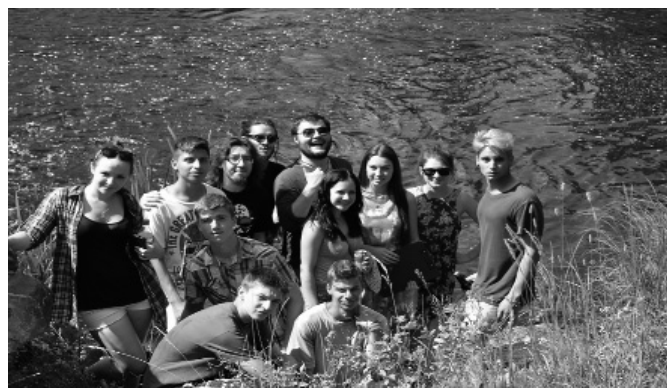
Attēlā: NFI apmācību norise brīvprātīgajiem jauniešiem.