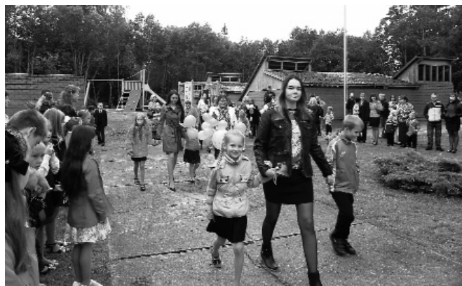
Attēlā: kā jau ierasts – 12.klase ievada 1.klases skolēnus skolas gaitās.