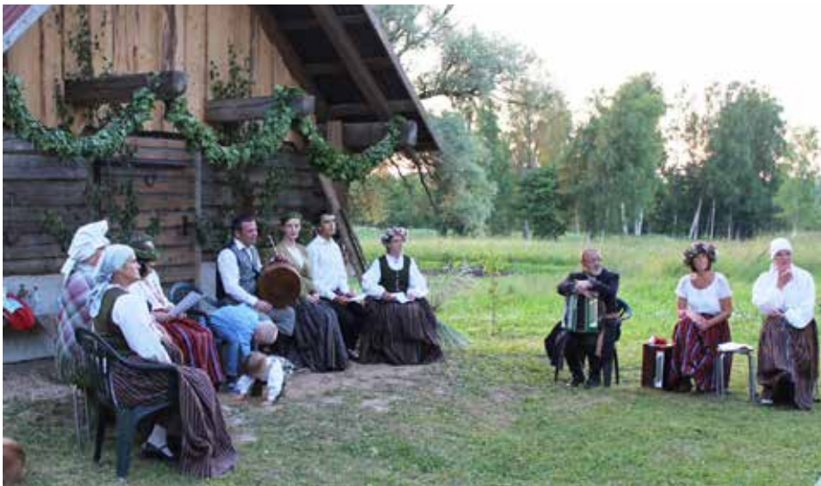
Attēlā: atklāšanas vakarā „Ķeiku” un „Seviķu” ļaudis pirms dziesmām.

Kad pagājušogad brāļu Jurjānu „Meņģeļos” muzejnieki jau posās atvadām, kā ierasts, tika apspriests nākamās vasaras semināra temats un norises vieta. Izskanot iecerētajai tēmai Dzimtu stāsti mūsdienu pasaulē, par iespējamo satikšanās vietu piedāvājām Jaunpiebalgu – slavenu vīru un sievu dzimteni, kas godā tur savu novadu un novadnieku piemiņu.