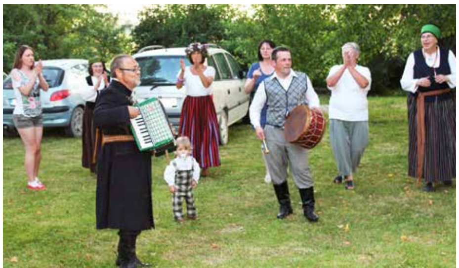
Attēlā: rotaļas „Ķeiku” pagalmā.