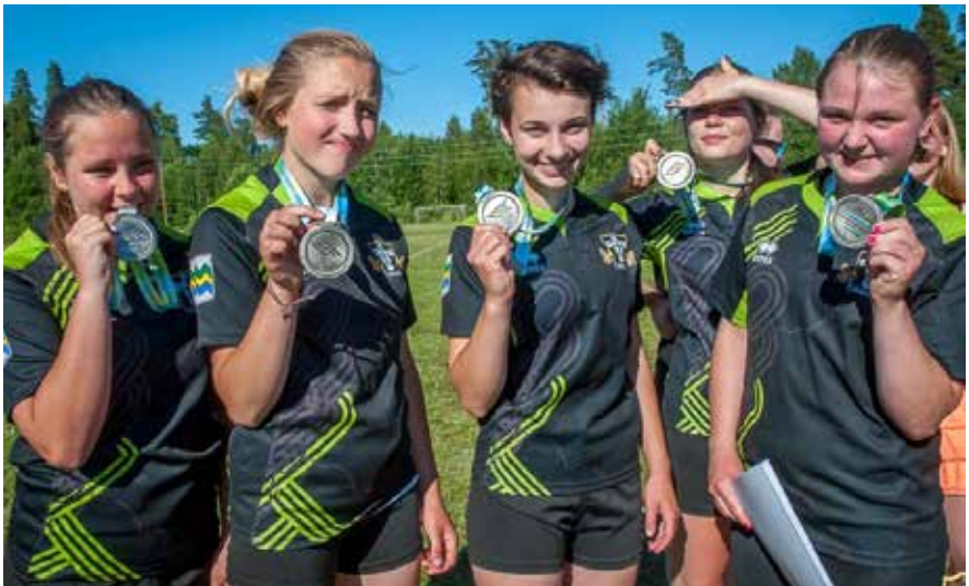
Attēlos: „Jaunpiebalga / Livonia” U18 meiteņu regbija komanda Latvijas Jaunatnes vasaras olimpiādē Valmierā.

„Jaunpiebalga / Livonia” U18 meiteņu komanda 13. jūnijā Upesciemā tika pie vēsturiska panākuma klubam, jo pirmo reizi kāda no RFC „Livonia” jauniešu komandām tika pie kāda titula - šoreiz Latvijas kausa ieguvēju goda.