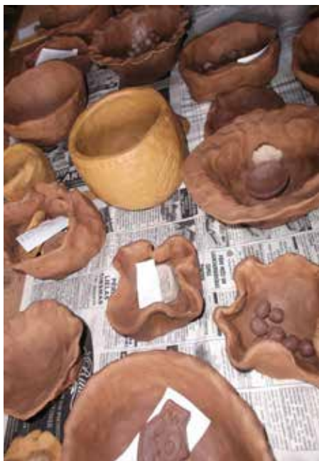
Mālošanas darbnīcā tapa dažādi trauki, arī krelles.

garšīgo ēdināšanu! Paldies nometnes rīkotājiem, ka varējām kārtīgi un superīgi izbaudīt pēdējo vasaras nedēļu ar labām emocijām!”