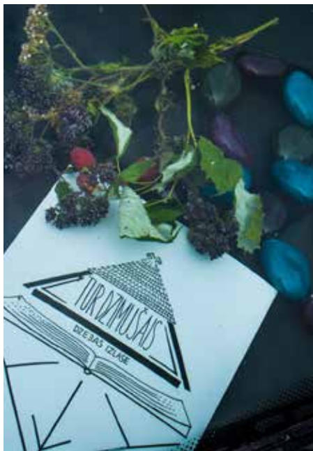
Viens no īpašajiem saieta notikumiem - dzejas grāmatiņas „Tur dzimušais” atvēršanas svētki.

Pasākuma ietvaros trīs dienas un divas nakts dabas saimniecības „Lielkrūzes” latviskajā vidē kopā bija un radošajā enerģijā, dziesmās un dzejā ar saviem skatītājiem un klausītājiem dalījās ap 150 dziesminieku un dzejnieku no visiem Latvijas novadiem.