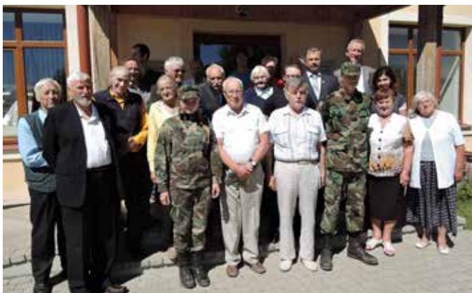
6. Piebalgas foruma „Piebaldzēni – par Latvijas neatkarību” dalībnieki.

Jūlija mēneša pēdējā sestdienā Jaunpiebalgas kultūras namā tika aicināti Atmodas laika aktivisti, lai piedalītos Piebalgas forumā „Piebaldzēni- par Latvijas neatkarību” un dalītos atmiņās par notikumiem pirms 25 gadiem, kad tika atjaunota Latvijas neatkarība.