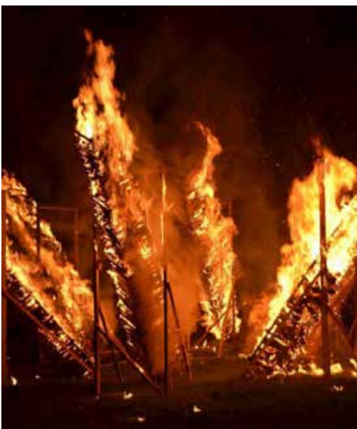
Skanot speciāli šim mirklim radītam grupas „Zāle” skaņdarbam ar Ojāra Vācieša vārdiem, tika aizdegta uguns skulptūra „Saules ceļš”.

Pasākuma ietvaros trīs dienas un divas nakts dabas saimniecības „Lielkrūzes” latviskajā vidē kopā bija un radošajā enerģijā, dziesmās un dzejā ar saviem skatītājiem un klausītājiem dalījās ap 150 dziesminieku un dzejnieku no visiem Latvijas novadiem.