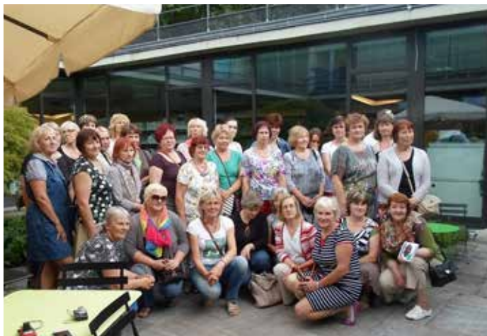
Berlīnes bērnu bibliotēkas iekšpagalmā

krājumu sastāda paleotipi- grāmatas, kas iespiestas no 1501. līdz 1550. gadam un 16. gadsimta otrās puses izdevumi, kuri tiek restaurēti un digitalizēti. Bibliotēkā strādā zinātnieki no visas pasaules. Pēc 2 gadiem visā Eiropā notiks Reformācijas 500 gadu atceres pasākumi, un to epicentrs būs tieši Vitenberga, kurā M.Luters pavadījis lielāko daļu sava mūža.