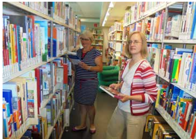
M.Lutera bibliotēkā (1847).

No 13. līdz 17. jūlijam ar autobusu veicām gandrīz 3500 km, gūstot daudz jaunu iespaidu. Apmeklējām Berlīnes jauniešu bibliotēku, Berlīnes pilsētas bibliotēku, Vitenbergas pilsētas bibliotēku un Mārtiņa Lutera bibliotēku Vitenbergā. Iepazināmies ar Vācijas bibliotēku sistēmu, darbu, attīstību un problēmām, guvām zināšanas, ierosmi un idejas turpmākajam darbam.