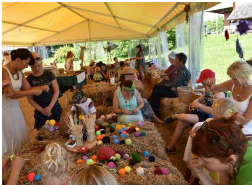
Apmeklētāju interesi un atsaucību guva šī saieta jaunumi – radošās amatnieku darbnīcas un latviskās dzīvesziņas skola.