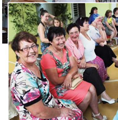
Viesus Pikurskolā teātra spēlēs iesaistīja improvizāciju teātris "Improv Zoo".