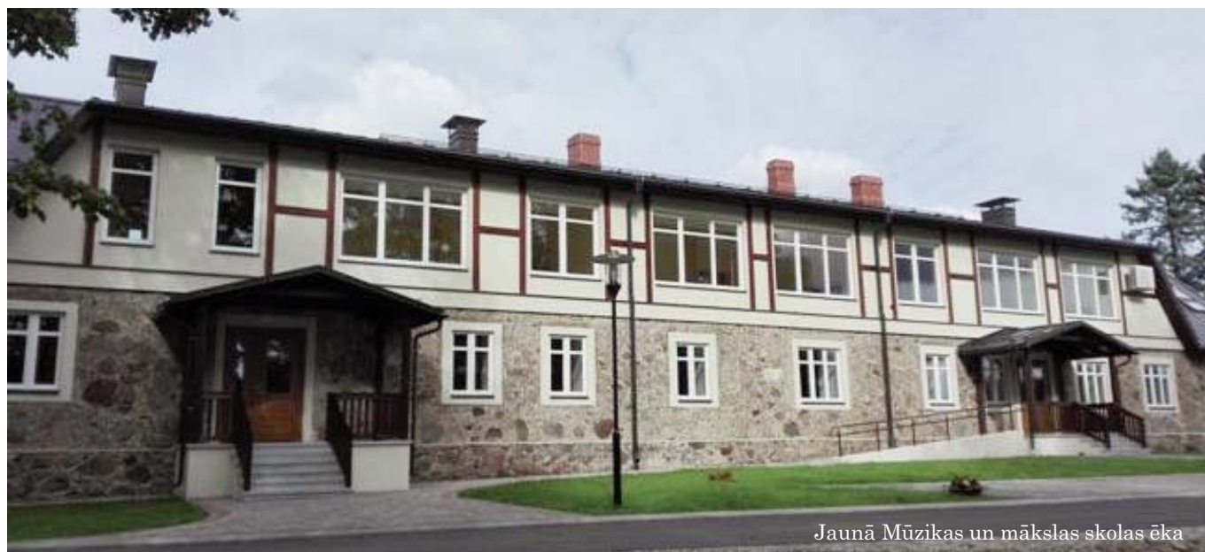
Jaunā Mūzikas un mākslas skolas ēka