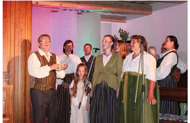
Ērgļu – Cīpuru dzimta.