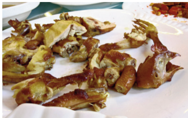
Attēlā: Ķīnas virtuve, reizēm uz galda bija arī šādi brīnumi...

sas palika kāds apgērba gabals, tas izmirka pilnībā. Kopumā pastaigai pa mūri veltījām trīs stundas. Dažviet tas bija kāpiens pa līdzenu virsmu uz augšu, bet dažviet tie bija pakāpieni augstumā pāri ceļgalam. Mēs tikai varējām brīnīties, kā augumā īso ķīniešu bērni viegli lēkāja pa šiem pakāpieniem.