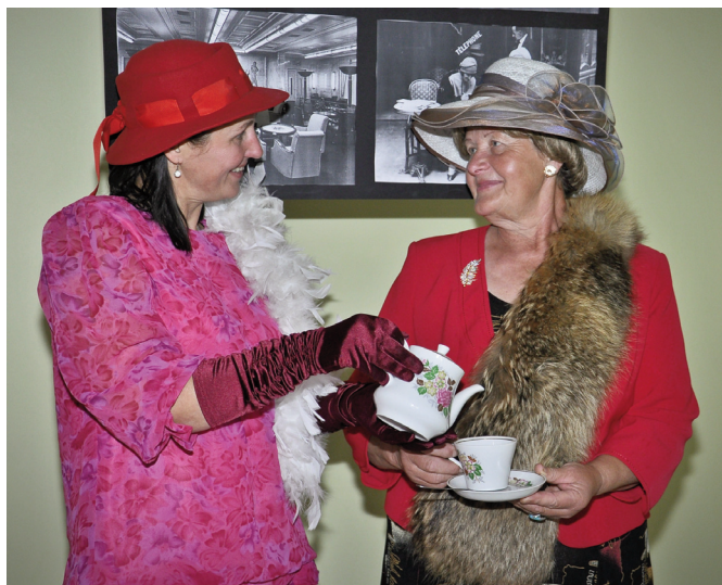
Attēlā: baudot kapeju ar kūkoniem.

- Ik gadu tiek padomāts arī par izstādes mazākajiem apmeklētājiem, lai arī viņiem būtu, ko redzēt.