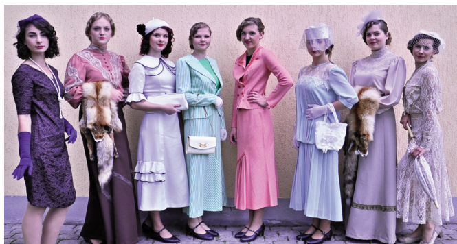
Attēlā: modes skates dalībnieces.