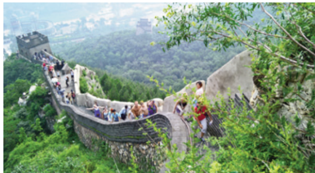
Attēlā: Lielais Ķīnas mūris – gājām, uzdziedājām...

Biju pārsteigts, cik tuvu Pekinas centram atrodas kāds no Lielā Ķīnas mūra fragmentiem. Braucienā līdz mūrim no pilsētas centra pavadījām gandrīz divas stundas bez sastrēgumiem. Izrādās, tas ir sarežģītāks veidojums, nekā domāju sākumā. Lielo mūri veido neskaitāmi atsevišķi fragmenti ap seno ķīniešu novadiem, un tikai vēlākā laikā veidojās viens vienots mūris ap seno Ķīnas valsti, sevišķi ziemeļos. Kopējais mūra garums arī nav tik viegli izsakāms, bet biežāk uzskatīts, ka tas ir ap 5000 kilometru garumā. Pie mūra nu jau atrādamies nosacīti ārpus Pekinas, bet debesis tāpat klāja dūmaka. Varbūt tā arī bija migla. Karstums nemazinājās, un kāpiena laikā svīdām trakāk nekā pirtī. Ja uz mie-