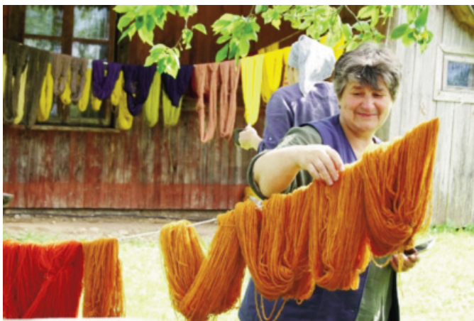
Attēlā: Valdai Denei gandarījums par krāsainajām dzijām.

Kad dzijas tika nokrāsotas, atlika laiks arī kādam eksperimentam. Un tā - līdzās dziju varavīksnēm arī krāšņās, saimnieku izlolotas aitādiņas.