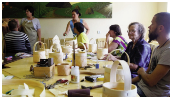
Attēlā: interesentiem bija iespēja gan ielūkoties skalu grozu tapšanā, gan arī pašiem iemēģināt roku šajā arodā.

Visas darbnīcas piedzīvotas projekta "Piebalgas seno un jauno amatu prasmes" ietvaros. Atbalsta – Kultūrkapitāla fonds.