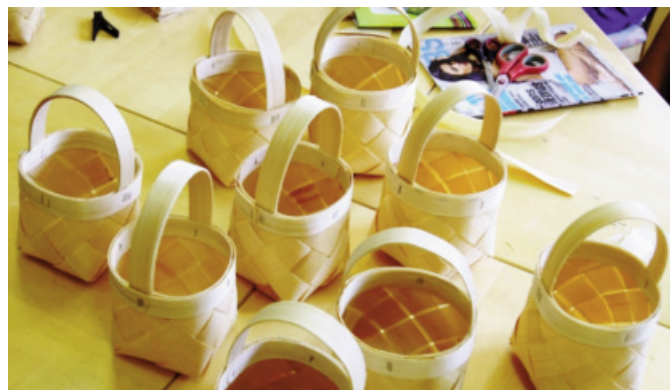
Attēlā: ūdenī mērkti, liepu skali pāris stundu laikā pārtapa neskaitāmos maziņos ogu groziņos!