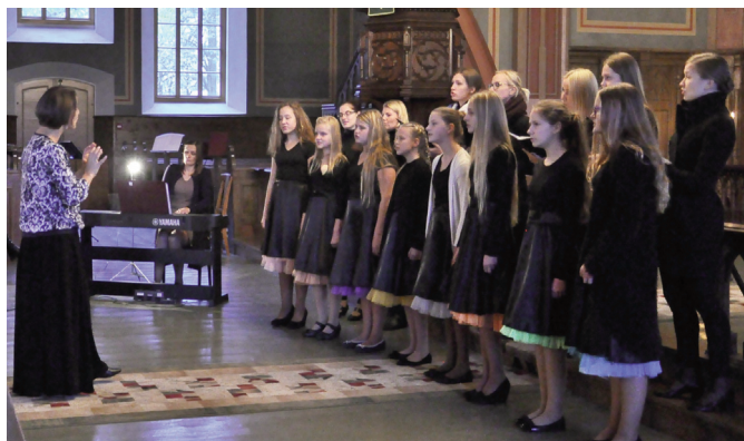
Attēlos: Rudens koncerts Jaunpiebalgas Sv. Toma ev. lut. baznīcā.