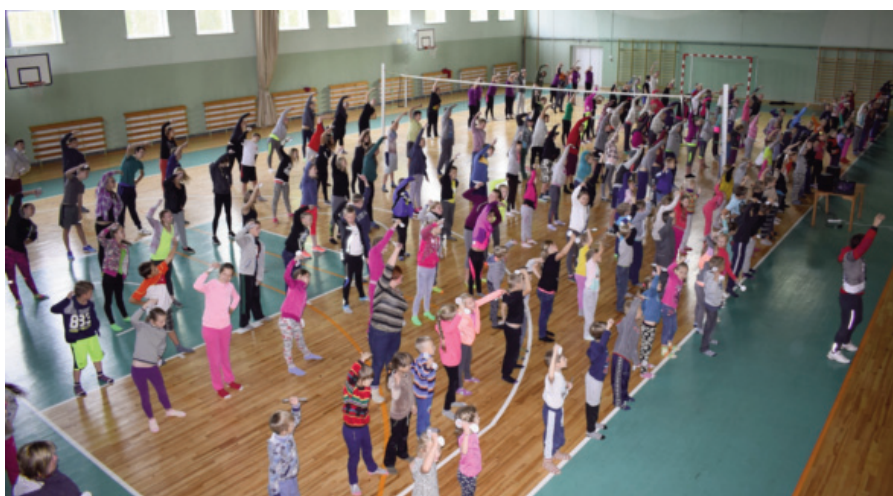
Attēlā: olimpiskā rīta vingrošana vidusskolas sporta zālē.