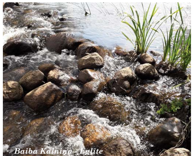
Baiba Kalniņa - Eglīte