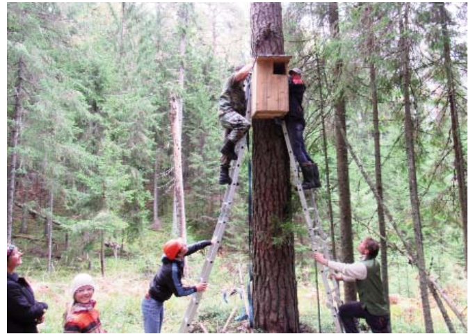
Attēlā: urālpūču būra uzstādīšana Lielmežā.

Tā kā intensīvās mežsīrādes dēļ mežos paliek arvien mazāk vecu, dobumainu koku, kur putniem ligzdot, tad cenšamies šo trūkumu mazināt, izvietojot Jaunpiebalgas mežos pūču būrus, kuru izmērs ir patiesi iespaidīgs. Arī tu vari tādu izgatavot un uzstādīt. Pamācības atrodamas Latvijas Ornitoloģijas biedrības mājas lapā. Piemēram: http://www.lob.lv/download/Buru_apraksti1.pdf