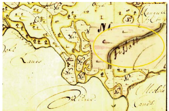
Attēlā: Lielmežā, Tirzas baseinā, ir daudz un dažādu pieteku. 1690. gada zviedru karte kā Aišas (kartē Aišate- Aissatt ) kreisā krasta pieteku uzrāda Glupupi .