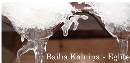
Baiba Kalniņa - Eglīte