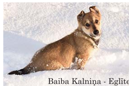
Baiba Kalniņa - Eglīte