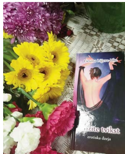
Liesmas Līgres – Uķes dzejoļu grāmata "Rozīte tvīkst"