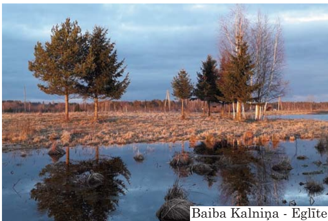
Baiba Kalniņa - Eglīte