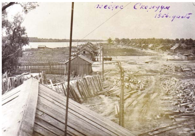
Skorodumas ciems 1956. gadā.