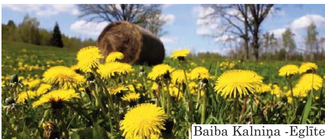
Baiba Kalniņa -Eglīte