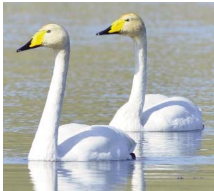
Ziemeļu gulbji.

Žanis Isajevs. Visbeidzot man bija prieks šo ziemeļu gulbi sastapt Ūdrupes apkaimē, Smiltenes novadā, šī gada oktobrī. Cerams, ka gulbim