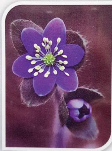
Jaunpiebalgas vidusskola 2021