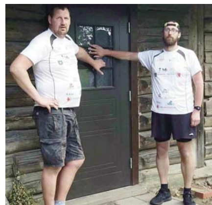
Brāļi kādā no iepriekšējo gadu pārgājiēniem.