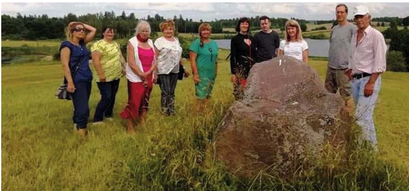
Gleznošanas plenēra dalībnieki

Alina Petkūne - grafiķe, dizainere un foto- māksliniece. Alinas darbi eksponēti vairāk nekā div-