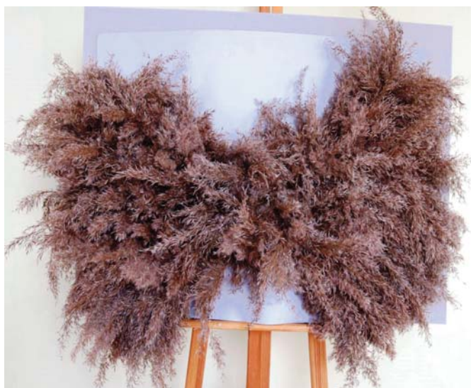
Edžus Kalnačs "Hedvigas (Harija Potera pūces) spārni"